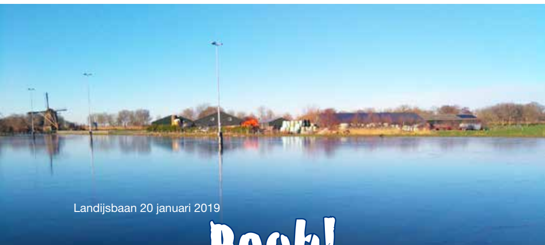
Landijsbaan 20 januari 2019