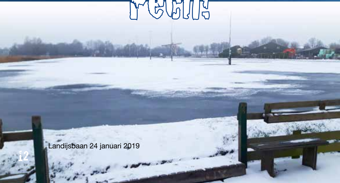
Landijsbaan 24 januari 2019